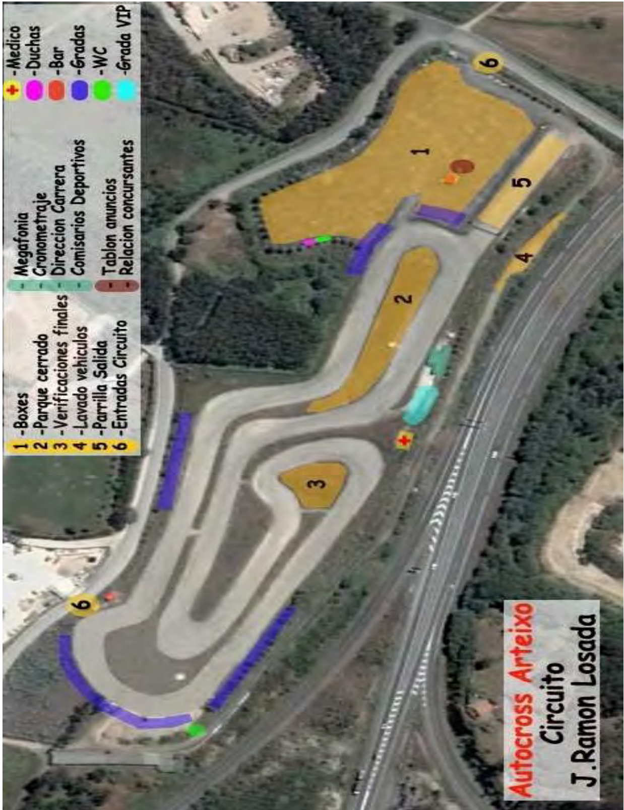
XIII Autocross Arteixo – Campeonato de España

CONCELO DE ARTEIXO Servicio Municipal de Deportes